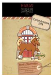
Centre de Loisirs 2019