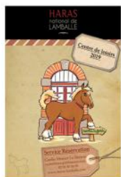
Centre de Loisirs 2019